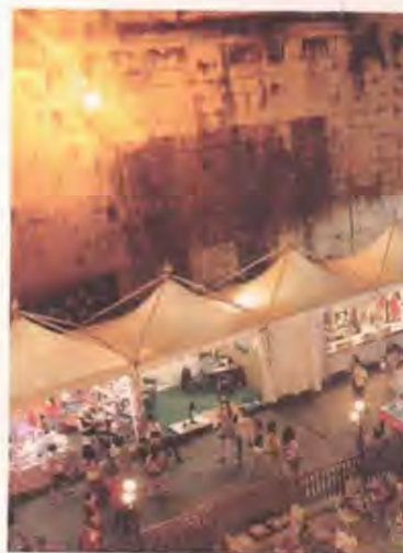
Un'immagine della scorsa edizione di "Lungo il Tevere...Roma"